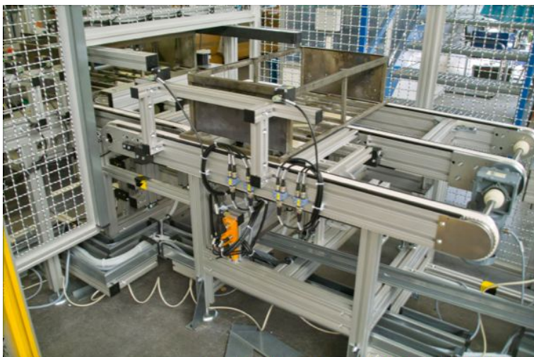
Verkettung Lötöfen für Ölkühler, WT-Rückführung