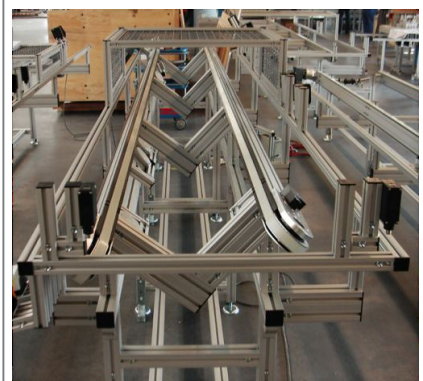
Verkettung Rohbaumontage „Blechteilzuführung Heckklappe“