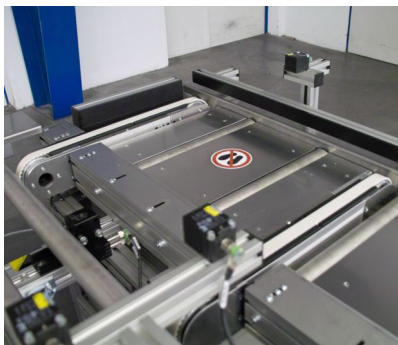
Zahnriemenförderer als Hub-Quer-Einheit in einem Rollenfördersystem